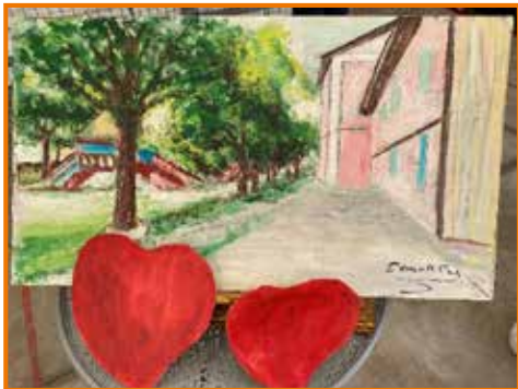
Disegno di Canelli Cesare

I prossimi appuntamenti si terranno a settembre, con il seguente programma: